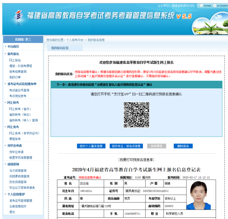
图 1.1 个人报考平台一报考状态结果查询

第二步: 报名考生打开本人实名认证的支付宝 APP, 使用支付宝“扫一扫”功能, 扫描网页“自考系统远程新生报名人脸识别身份信息认证”上显示的二维码, 进入手机上“福建省自学考试人脸识别及身份证信息采集的实名认证系统”确认。