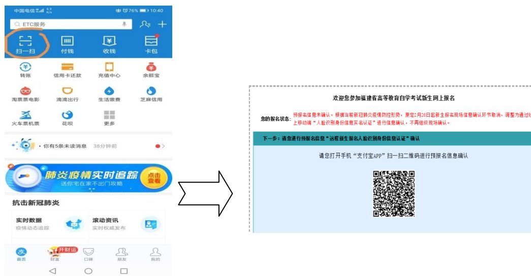
图 2.1 使用支付宝“扫一扫”, 扫描“自考报考系统远程身份信息认证平台”上的二维码

第二步: 报名考生打开本人实名认证的支付宝 APP, 使用支付宝“扫一扫”功能, 扫描网页“自考系统远程新生报名人脸识别身份信息认证”上显示的二维码, 进入手机上“福建省自学考试人脸识别及身份证信息采集的实名认证系统”确认。