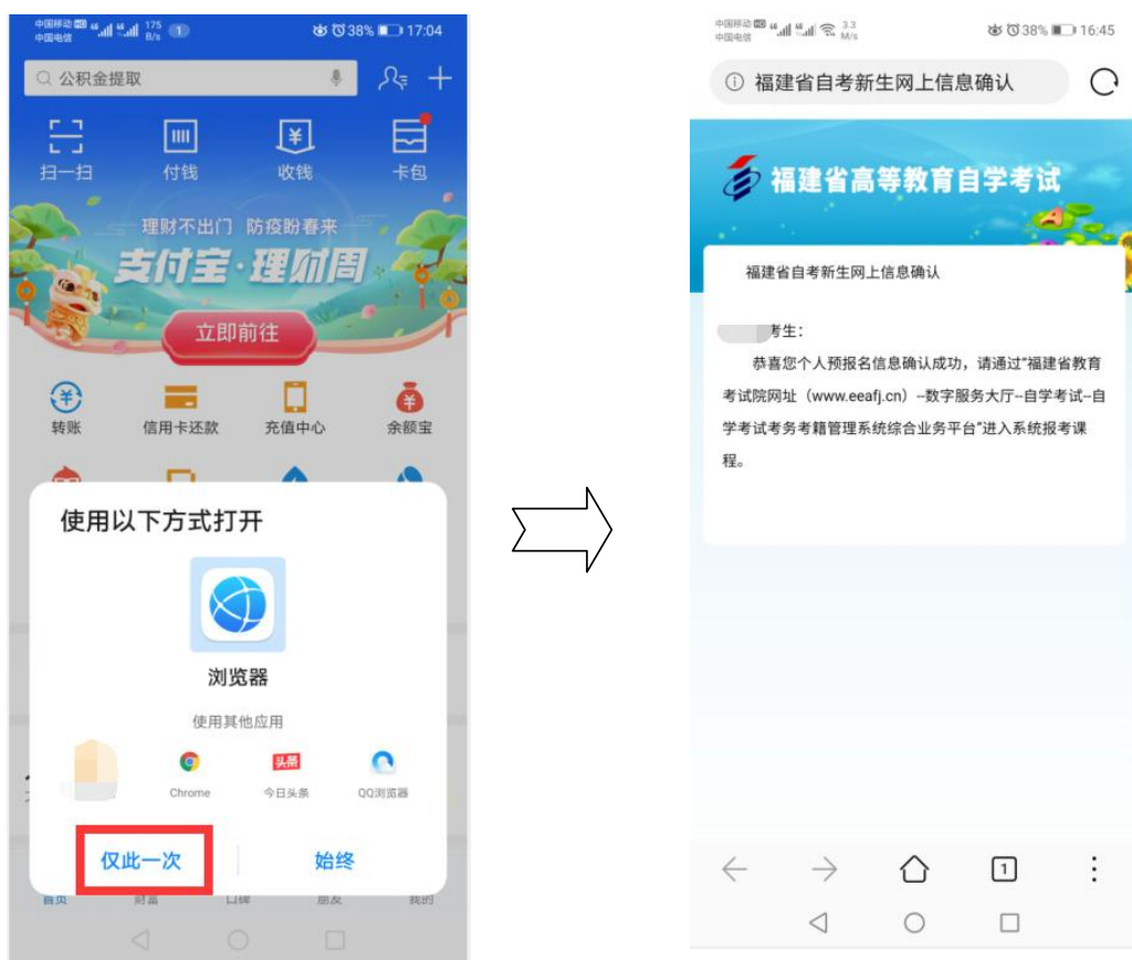
图 6.1 点击“仅此一次”，即可完成新生报考网上个人信息确认

第六步： 点击“返回”后，在手机“支付宝 APP”上出现如下图，使用默认浏览器点击“仅此一次”，即可完成新生报考网上个人信息确认的全部流程。