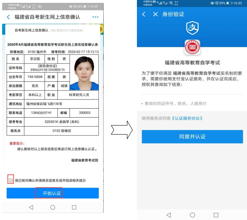
图 3.1 核对报名信息表并进入认证